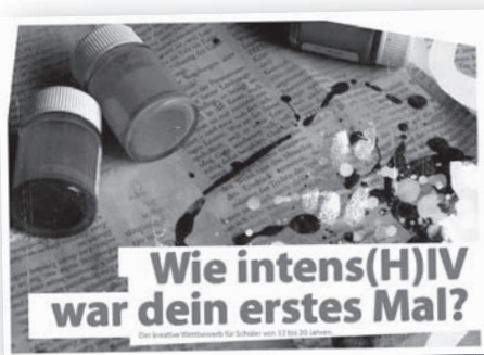
Ausschreibung des Schülerwettbewerbs 2010 »(H)insehen. (I)nititative ergreifen. (V)erantwortung übernehmen.«, entworfen von den Multis