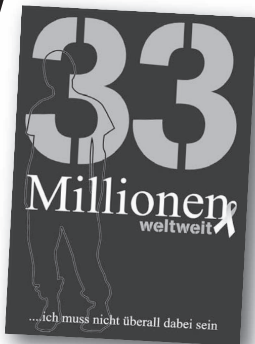
Siegermotiv des Schülerwettbewerbs 2010 »(H)insehen. (I)nititative ergreifen. (V)erantwortung übernehmen.« der Multis, entworfen von Schülern des BVJ 10/1 der Arwed-Rosbach-Schule in Leipzig